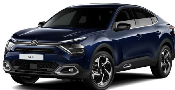
Azul Eclipse Opción