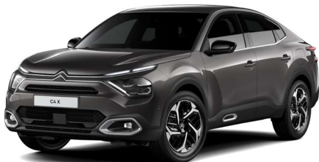
Gris Platino Opción