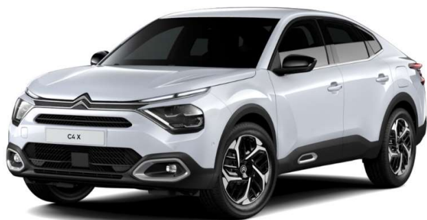
Blanco Okenite Opción