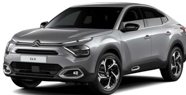
Gris Acero Opción