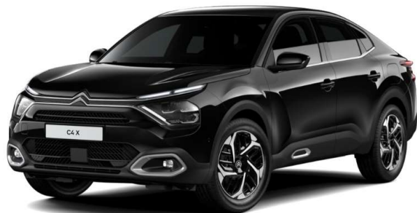
Negro Perla Nera Serie