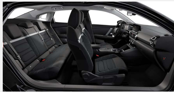
Ambiente Interior de Serie - Tela