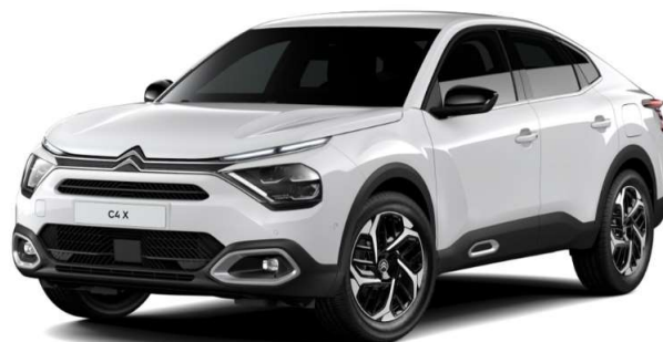
Blanco Banquise Opción