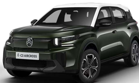
Verde Montana Techo bitono Blanco Natural Opción