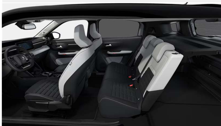
Ambiente Interior de Serie -Metropolitan Grey

Tejido Hello / TEP gris claro con asientos Citroën Advanced Comfort®