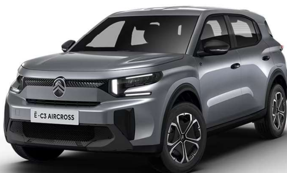
Mercury Grey Techo color carrocería Opción