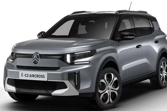
Mercury Grey Techo Color Carrocería - Serie Techo Bitono Negro Perla Nera - Opción Color Clip Blanco Polar Opción