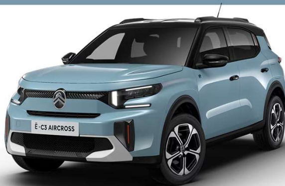
Azul Monte Carlo Techo Bitono Blanco Ópalo Color Clip Rojo André Serie