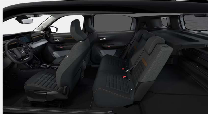
Ambiente Interior de Serie -Urban Bronze