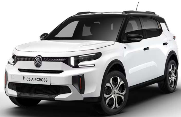
Blanco Polar Techo Color Carrocería – Serie Techo Bitono Negro Perla Nera – Opción Color Clip Rojo André Opción