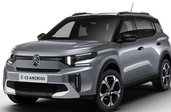
Mercury Grey Techo Bitono Negro Perla Nera – Serie Techo Color Carrocería – Opción Color Clip Blanco Polar Opción