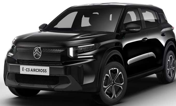
Negro Perla Nera Techo color carrocería Opción