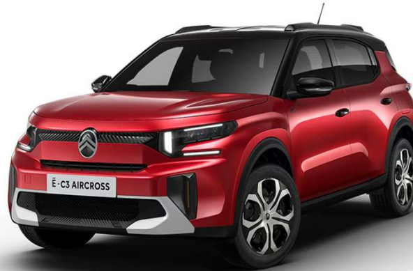
Rojo Elixir Techo Bitono Negro Perla Nera – Serie Color Clip Bronce Opción