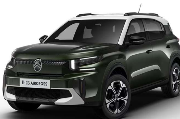
Verde Montana Techo Bitono Balnco Natural – Serie Color Clip Bronce Opción