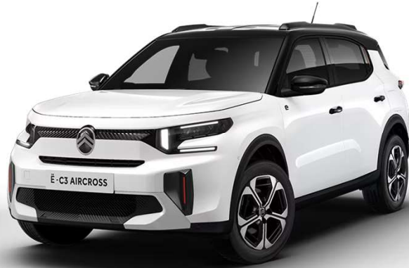
Blanco Polar Techo Bitono Negro Perla Nera – Serie Techo Color Carrocería – Opción Color Clip Rojo André Opción