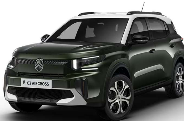
Verde Montana Techo Bitono Blanco Natural– Serie Color Clip Bronce Opción