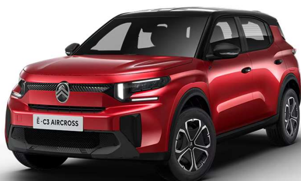
Rojo Elixir Techo bitono Negro Perla Nera Opción