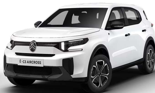
Blanco Polar Techo color carrocería Opción