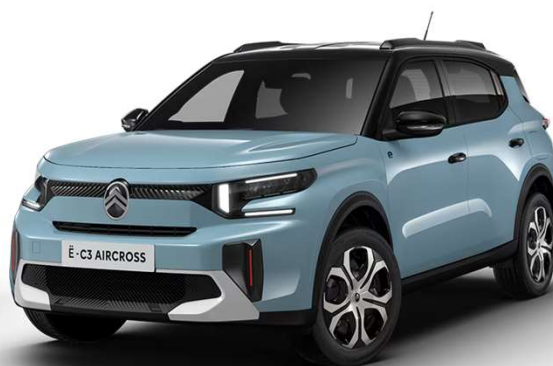
Azul Monte Carlo Techo Color Carrocería - Serie Techo Bitono Negro Perla Nera - Opción Color Clip Rojo André Serie