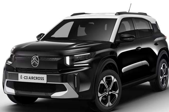
Negro Perla Nera Techo Bitono Blanco Natural – Serie Techo Color Carrocería – Opción Color Clip Blanco Polar Opción