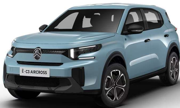
Azul Monte Carlo Techo color carrocería Serie