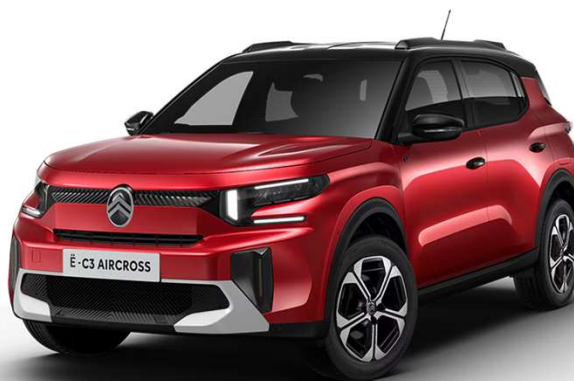
Rojo Elixir Techo Bitono Negro Perla Nera – Serie Color Clip Bronce Opción