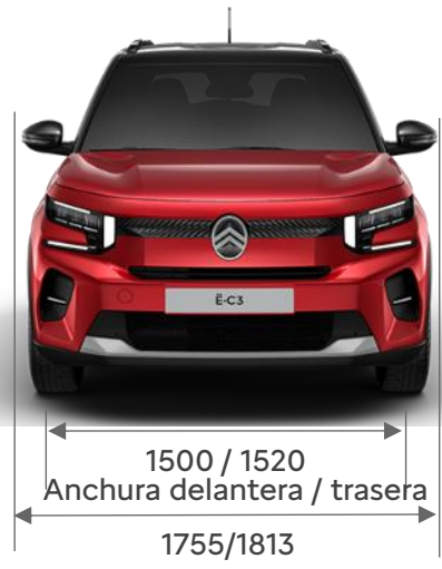
Ancho del vehículo con / sin retrovisores plegados