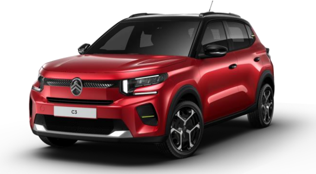
Rojo Elixir Techo Bitono Negro Perla Nera – Serie Techo Color Carrocería – Opción Color Clip Neon Lemon Opción