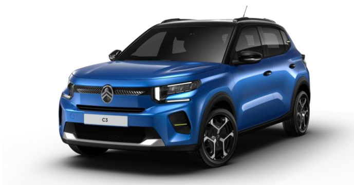
Azul Brillante Techo Bitono Negro Perla Nera – Serie Color Clip Neon Lemon Opción