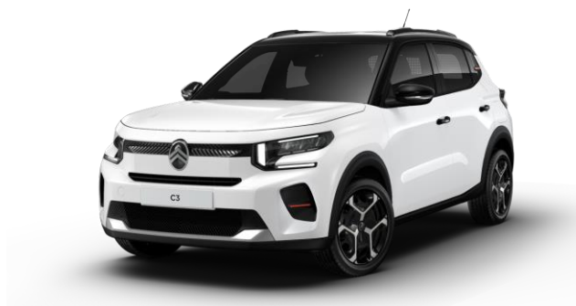
Blanco Polar Techo Bitono Negro Perla Nera – Serie Techo Color Carrocería – Opción Color Clip Rojo André Opción