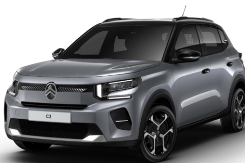
Mercury Grey Techo Bitono Negro Perla Nera – Serie Techo Color Carrocería – Opción Color Clip Blanco Polar Opción