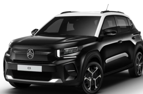
Negro Perla Nera Techo Bitono Blanco Ópalo – Serie Techo Color Carrocería – Opción Color Clip Blanco Polar Opción