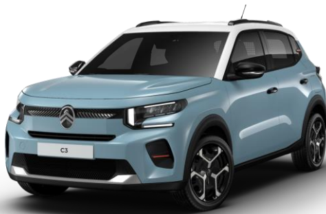
Azul Monte Carlo Techo Bitono Blanco Ópalo Color Clip Rojo André Serie